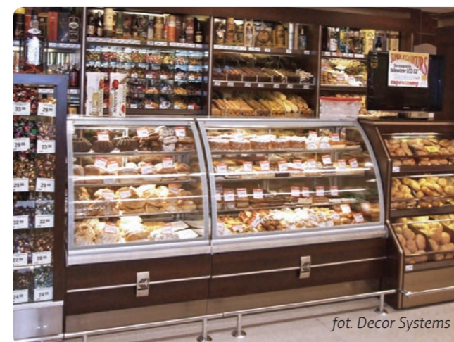
fot. Decor Systems